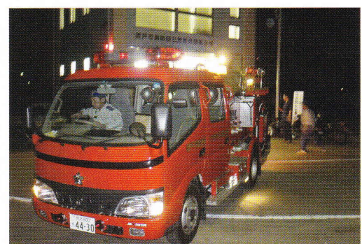
1班夜警巡回終了、お疲れ様！

と思っただけすぐに柔和な表情に。「互いに思いやり、尊重し合える大人の集団であることが、第3部の最大の特長」と、静部長が言つと、男たちはそれぞれに大きくうなずいた。そして、