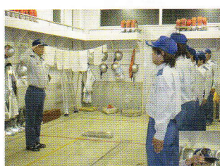
車庫の清掃→力を合わせて